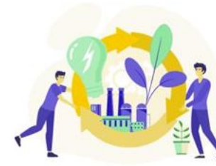
Circular Products and Services Lab

Innovazione circolare nella supply chain per una gestione sostenibile e digitale.