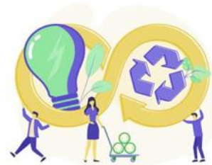
Circular Supply Chain Management Lab

Innovazione circolare nella supply chain per una gestione sostenibile e digitale.