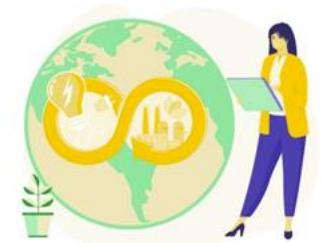
Sustainability Governance Lab

Innovazione per lo sviluppo e la diffusione di prodotti e servizi circolari.